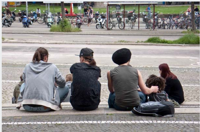
Aus der Ausstellung - Wem gehört die Stadt? – von Claudia Fritz

Nach dem Prinzip der „Stadtschreiber“ bietet die Freiburger Bürgerstiftung seit 2006 jungen FotografInnen die Möglichkeit, die Stadt „mit dem Blick von außen“ festzuhalten. Keine touristischen Idyllen, sondern Bilder vom Leben in Freiburg sind in den Jahren 2006, 2008, 2010 und 2013 entstanden und wurden jeweils im Wentzinger-aus ausgestellt.